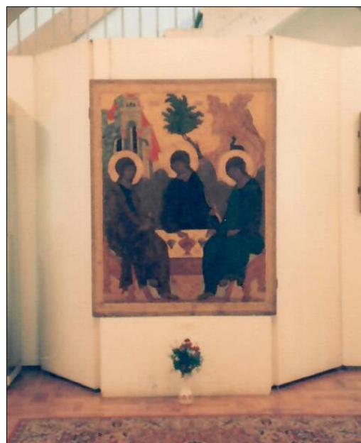
Icona della Santissima Trinità di Rubliov