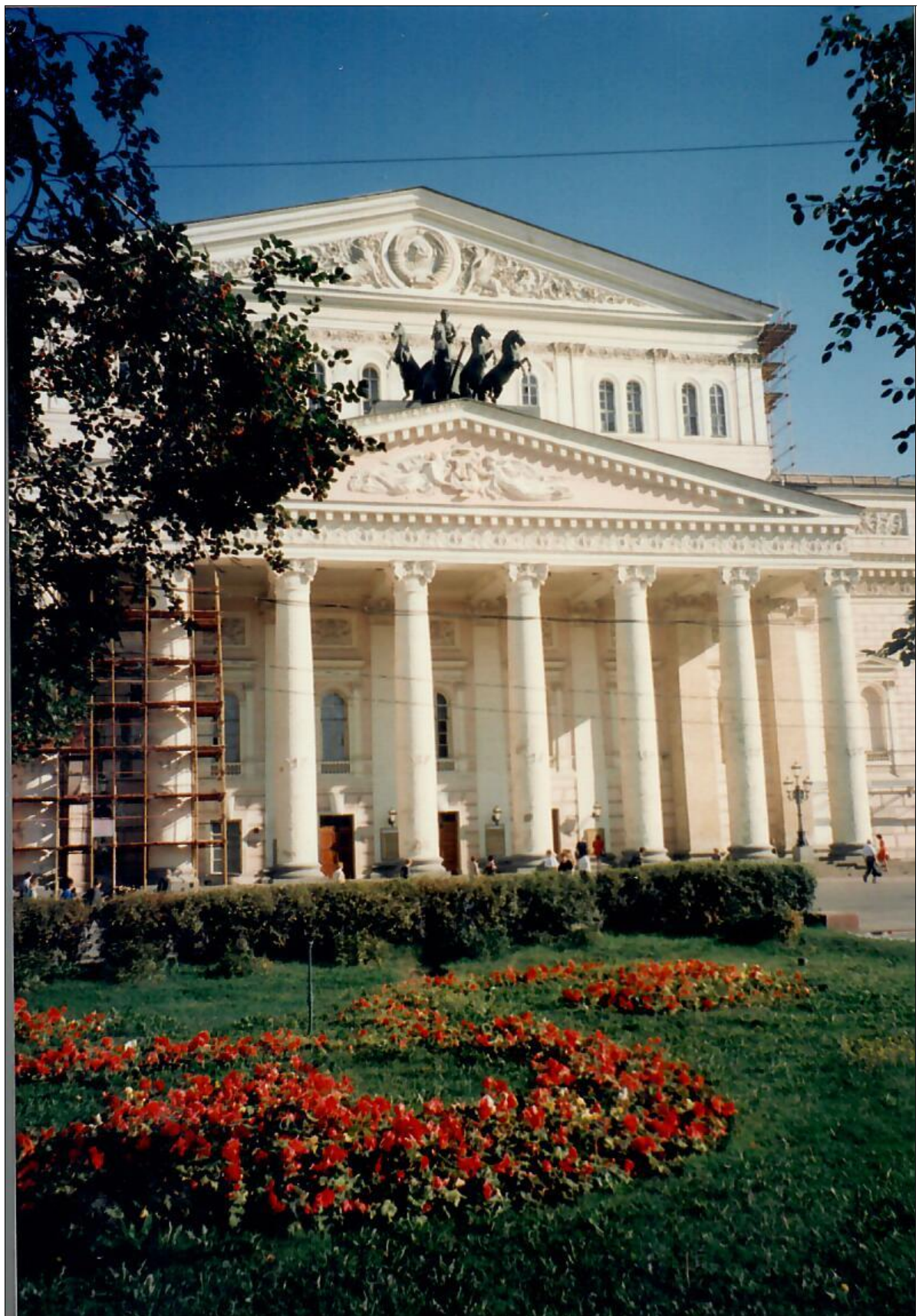
Giratina a piedi dal Bolshoj fino alle chiese davanti all'Hotel Russia.