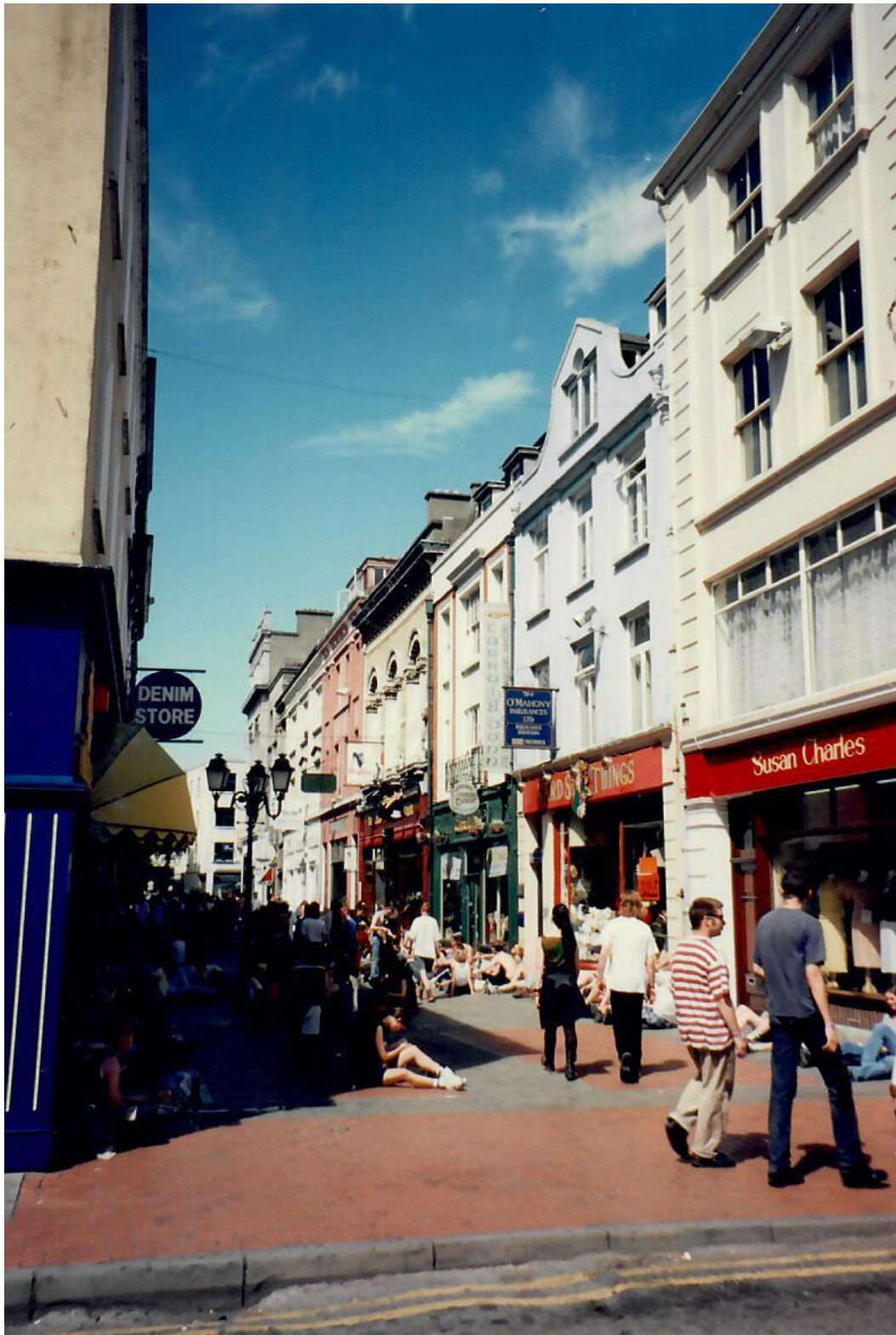
A Bantry vediamo la Bantry House: una abitazione alto-borghese con ricchi arredi, un po' délabré ma interessante. Un bel panorama sul golfo, lunga passeggiata nel bel giardino che si sviluppa a monte della villa: una scala di 100 gradini da salire e da scendere. Piacevole.